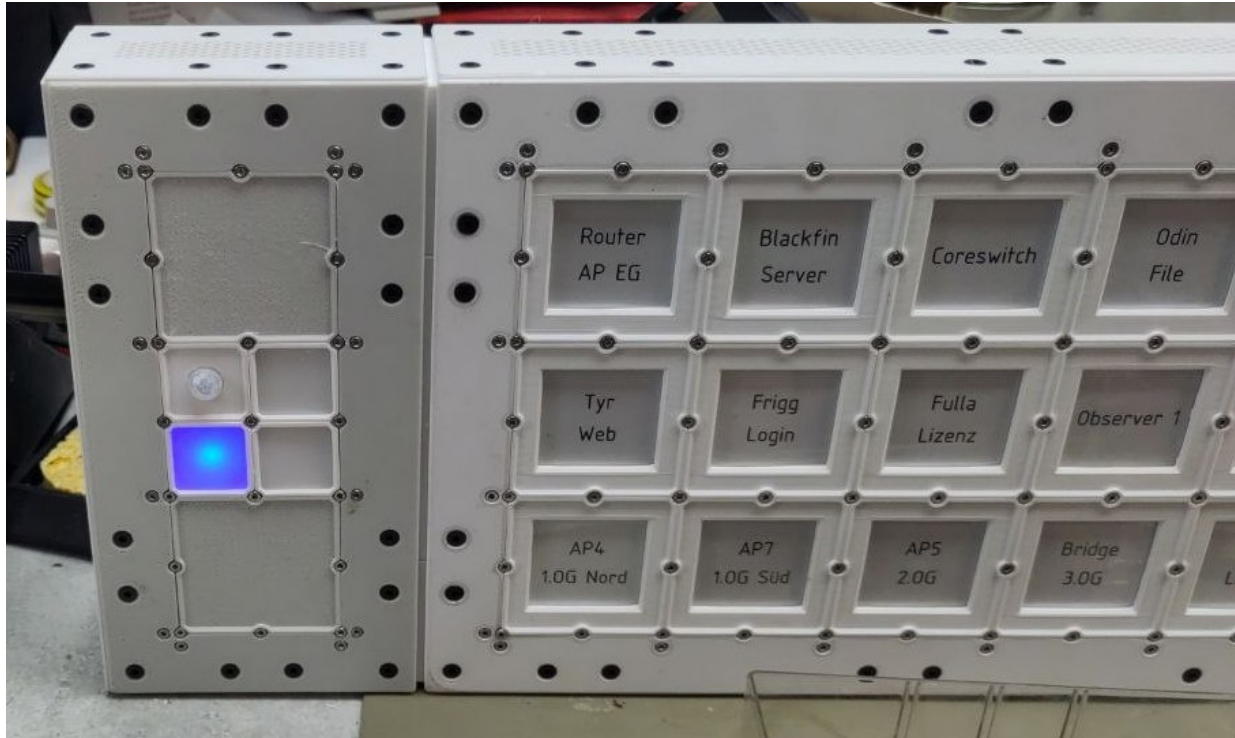
Schaubild 1: Teilansicht World Domination Panel

Ecken mit Zylinderkopfschrauben M2x4 V2A